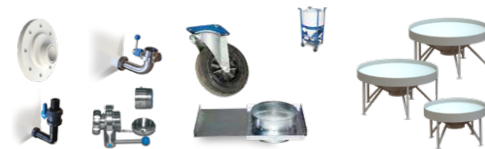
Tilbehør for beholdere med konisk bunn