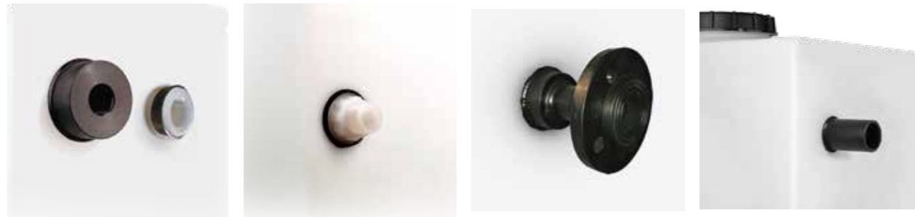
Tilkoblinger innvendige gjenger

Våre dyktige montører kan også sette sammen ditt eget unike tilbehør eller utstyr. Ta kontakt med dine spesifikke ønsker. Sveising utføres i henhold til EN 13067.