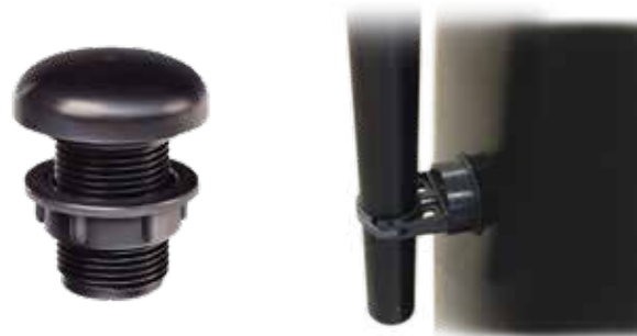
Ventilasjonsfilter med klemskrue