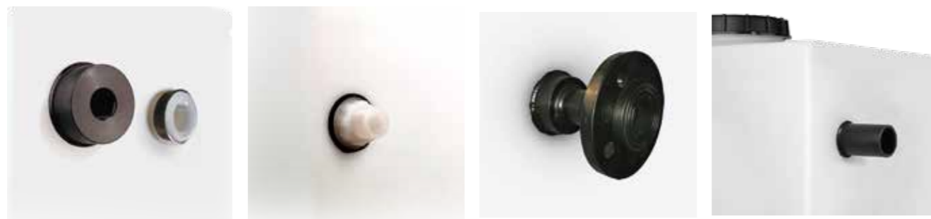
Tilkoblinger innvendige gjenger

Våre dyktige montører kan også sette sammen ditt eget unike tilbehør eller utstyr. Ta kontakt med dine spesifikke ønsker. Sveising utføres i henhold til EN 13067.