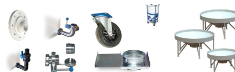
Tilbehør for beholder med konisk bunn