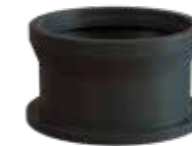
CPX VERLENGSCHACHT Geschikt voor CPX wateropslagtanks.

Maat: Ø 600 Hoogte: 250 mm Installatiediepte: 250 mm Art. Nr. 450251