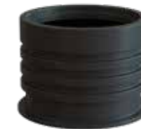
CPX VERLENGSCHACHT Geschikt voor CPX wateropslagtanks.

Maat: Ø 600 Hoogte: 400 mm Installatiediepte: 400 mm Art. Nr. 450501