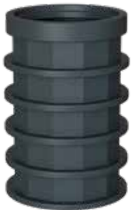
CPX VERLENGSCHACHT - CUT TO SIZE Geschikt voor CPX wateropslagtanks.

Maat: Ø 600 Hoogte: 550 mm Installatiediepte: 550 mm Art. Nr. 450121